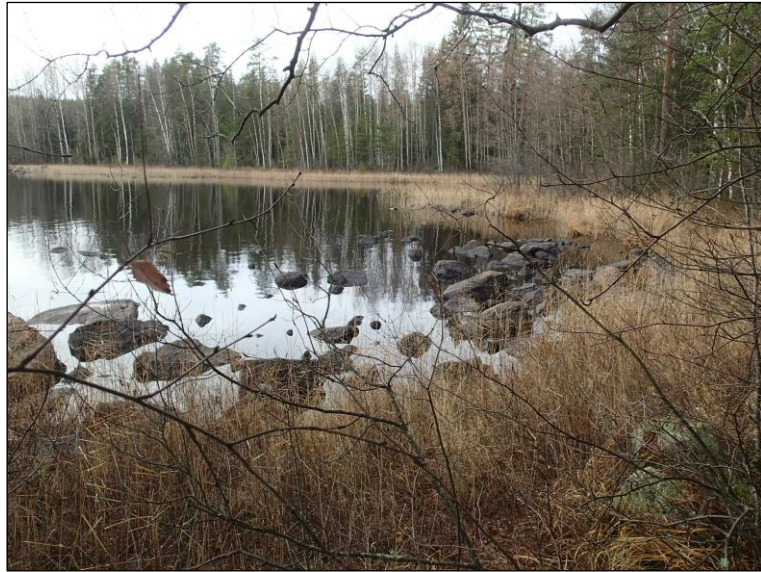
Alueen etelärannan itäpuoliskon rantaa