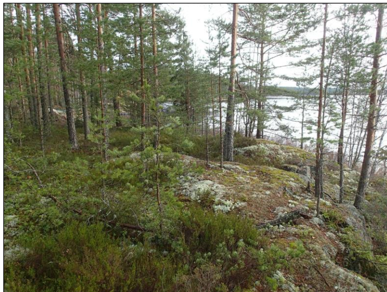
Alueen etelärannan länsiosaa, itään.