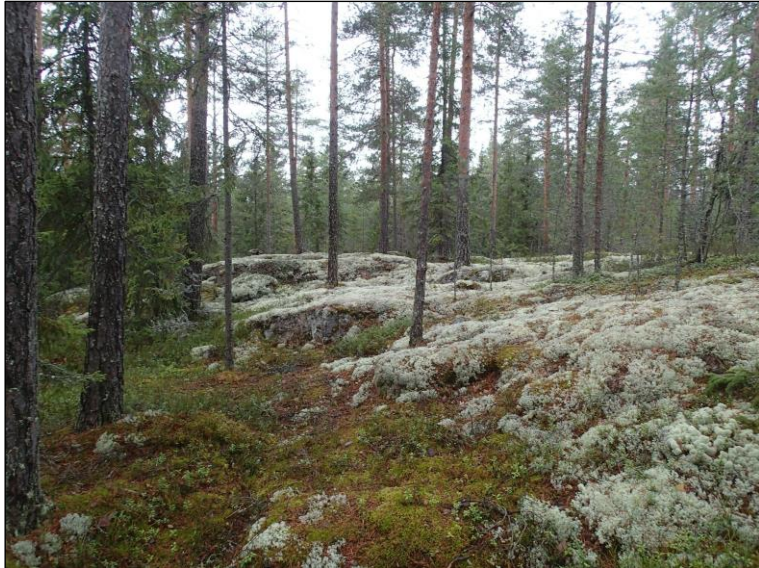
Alueen keskiosan kallioaluetta.