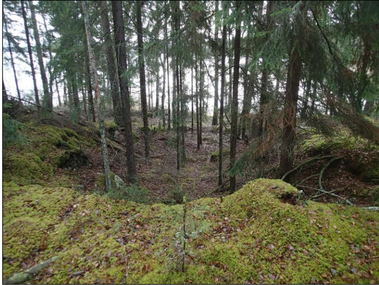
Vanha maanottopaikka alueen etelärannan keskivaiheilla