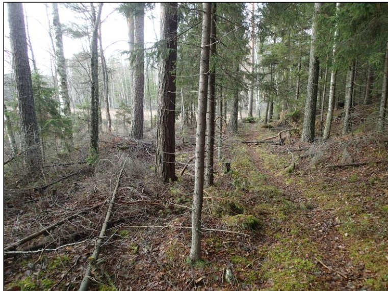
Alueen etelärannan keskiosan rantaa